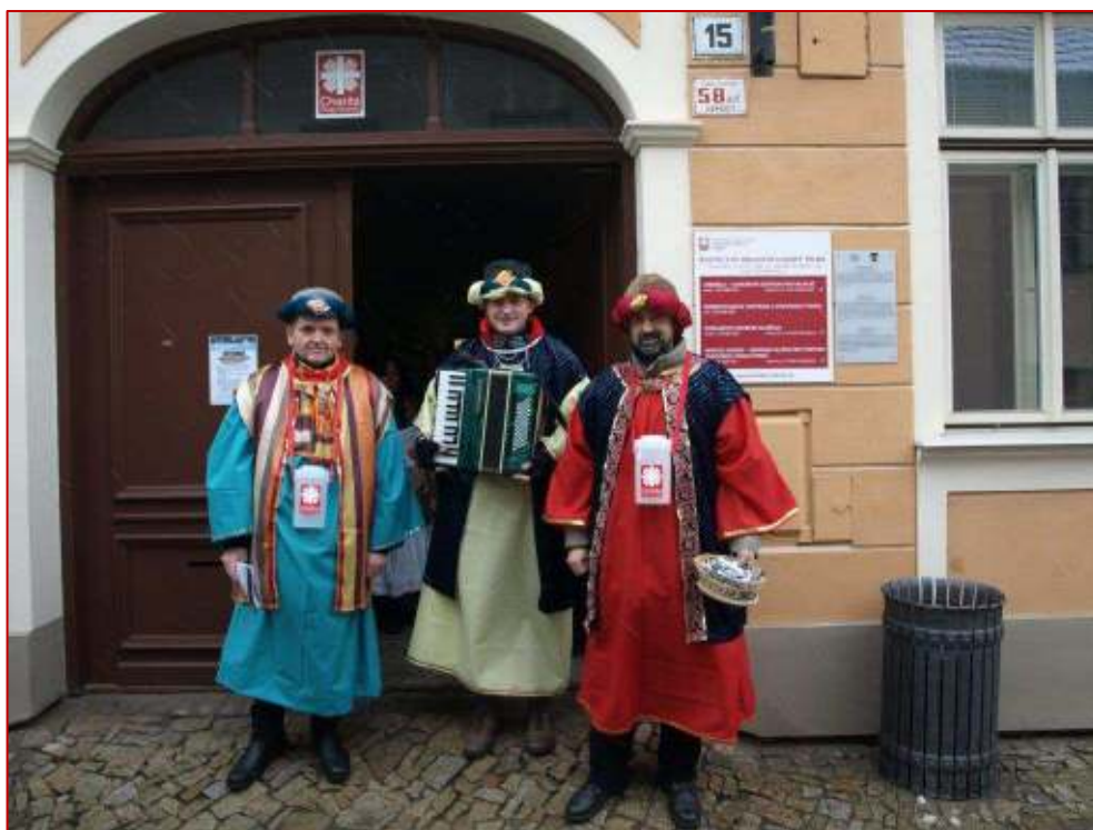
Naši koledníci v nových kostýmech

V letošním roce jsme měli pozitivní ohlas na koledníky, kteří byli oblečeni v kostýmech. Tyto kostýmy si koledníci většinou obstarávali sami nebo nás prosili o zapůjčení. Na letošní rok naše dlouholetá dobrovolnice ušila plno krásných nových kostýmů, poptávka však byla vyšší. Proto jsme nelenili a začali se sháněním metrového textilu. Od jedné firmy se nám podařilo získat větší množství látek, které budou k dispozici pro Vás všechny, kteří byste chtěli pro své koledničky v obci zhotovit tříkrálové kostýmy. Látky si lze vyzvednout v Dobrovolnickém centru v Oblastní charitě Třebíč, L. Pokorného 15 – Židovská čtvrt'. Hledáme také šikovné švadlenky, které by byly ochotny ušít kostýmy pro třebíčské koledníky. Veřejnost koledníky v kostýmech vítá s laskavým přístupem, proto Vás prosím o pomoc.