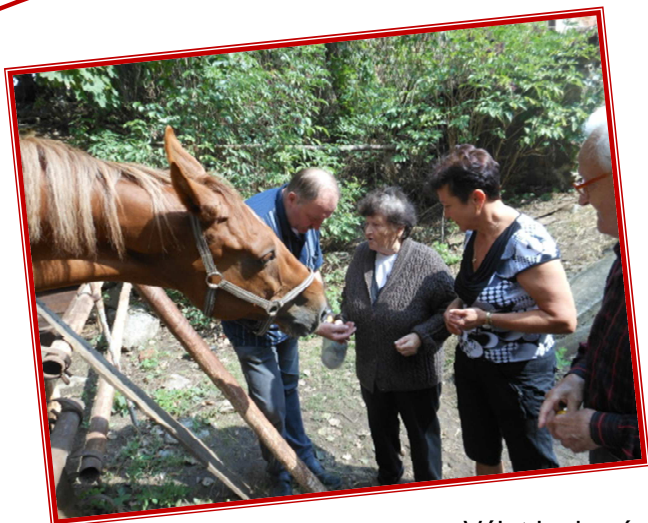
Výlet ke koním