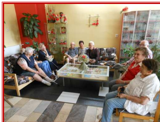
Návštěva knihovny na Modřínové ul.

Souhlasíte s námi, že společná písnička udělá dobrou náladu? Přijďte mezi nás. A jak se v Domovince žije, vám napoví písnička DO-MO-VINKA, DOMOVINKA (na melodii Já už jdu, už mám všechno hotový)